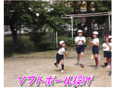
ソフトボール投げ